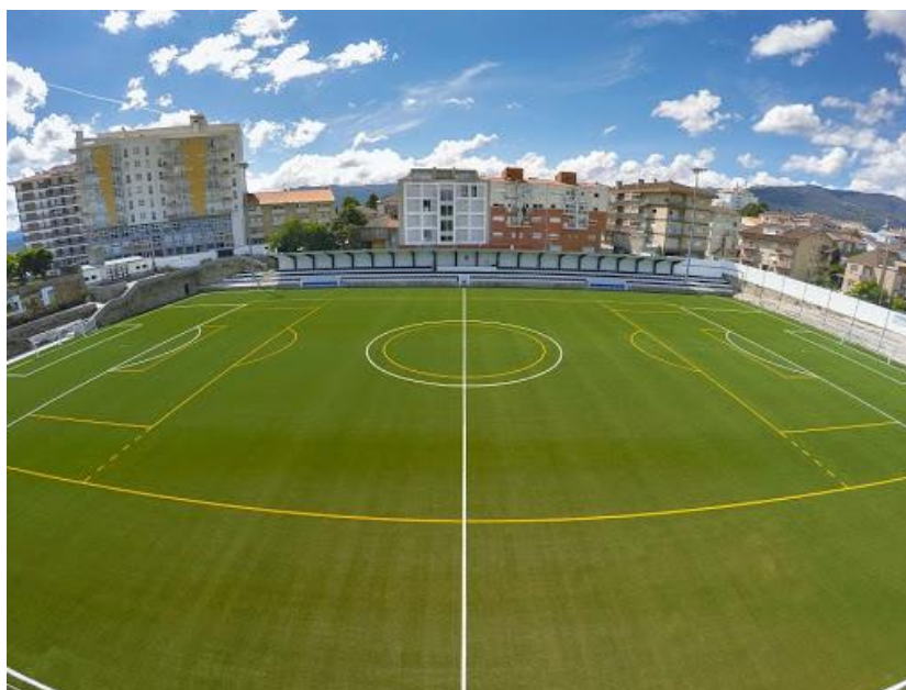
Figura 1-Campo do Calvário

Os locais de treinos e competição (em condição de visitado) das equipas de formação do clube será o Campo do Calvário.